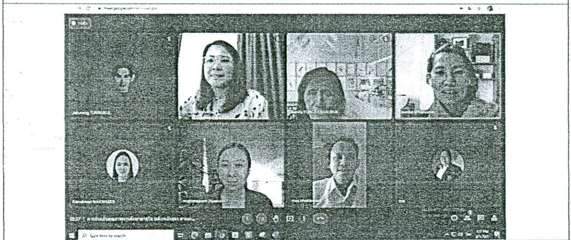
สัมภาษณ์ศิษย์เก่า