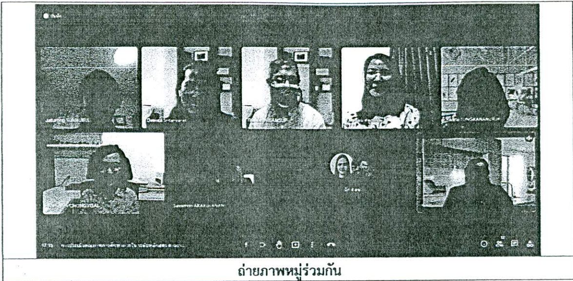
ถ่ายภาพหมู่ร่วมกัน