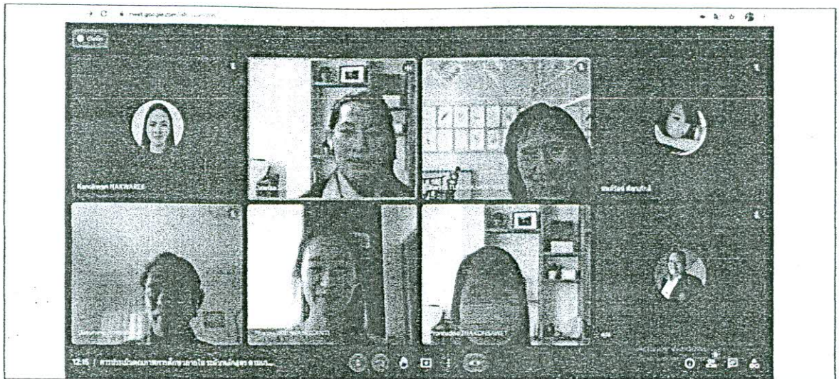
สัมภาษณ์นิสิต