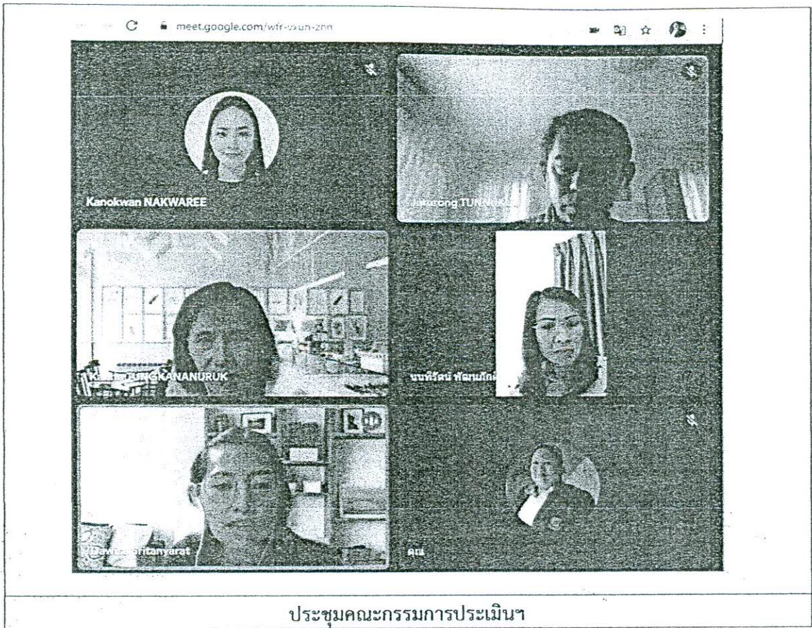
ประชุมคณะกรรมการประเมินฯ